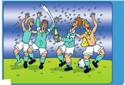
Finde die acht Fehler!